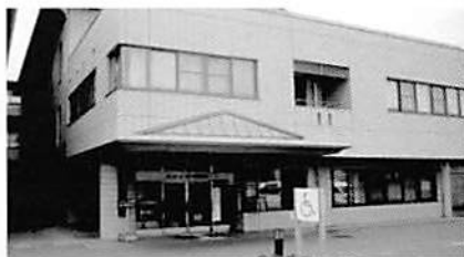
Lサポート (サントピア内1階)

現在の久堅農園は共同生活介護・支援事業としてグループホーム運営をしており東栄町の利用者さんの生活訓練の場としても利用しています。