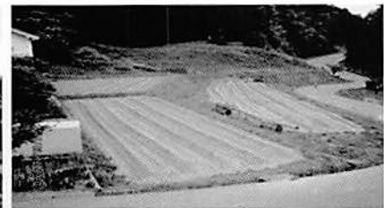
おいしいお米が取れる田

心のリフレッシュとして「お花見・緑陰を訪ねる・紅葉狩り・クリスマス会食」と季節に応じた行事で身近にある豊かな自然を満喫しています。