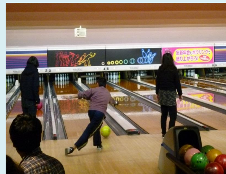
佐久圏域 佐久プラザボウル 平成 29 年 11 月 18 日