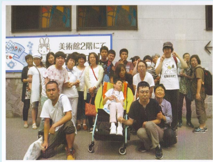
大町市手をつなぐ育成会 諏訪地方へバス旅行 平成 29 年 8 月 26 日