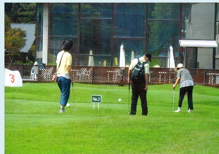
中野市手をつなぐ育成会 タングラム斑尾でマレットゴルフ 平成 29 年 9 月 10 日