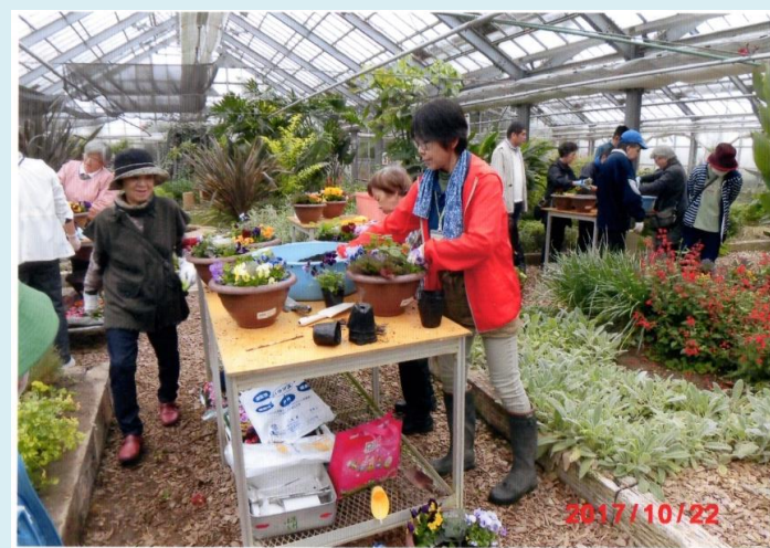
池田町手をつなぐ育成会 池田町ハーブセンター てる坊市場 平成 29 年 10 月 2 日