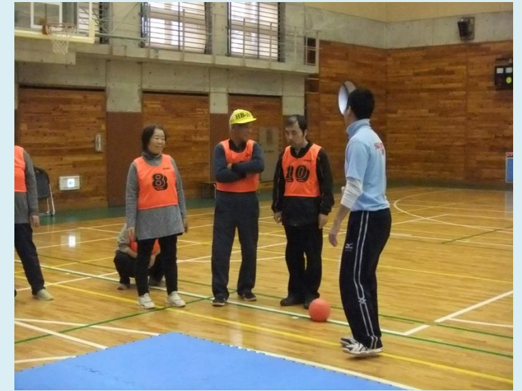
飯山市手をつなぐ育成 サンアップルでニュースポーツ平成 29 年 11 月 19 日