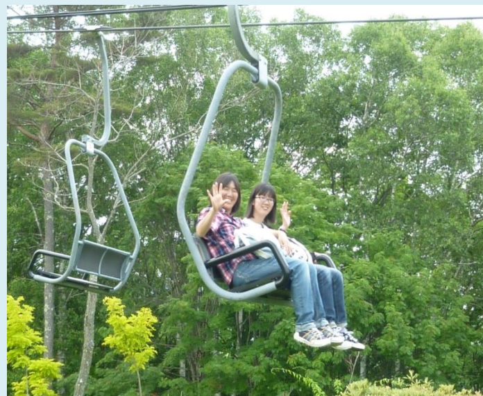
飯綱町手をつなぐ育成会 池の平ファミリーランド 平成 29 年 7 月 8 日