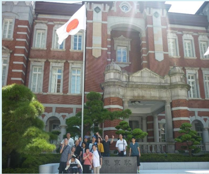
松川村手をつなぐ育成会 東京都内観光バス平成 29 年 9 月 2 日～3 日