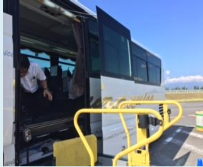
須坂・小布施・高山手をつなぐ育成会 リフトバスで諏訪湖の旅 平成 29 年 9 月 24 日