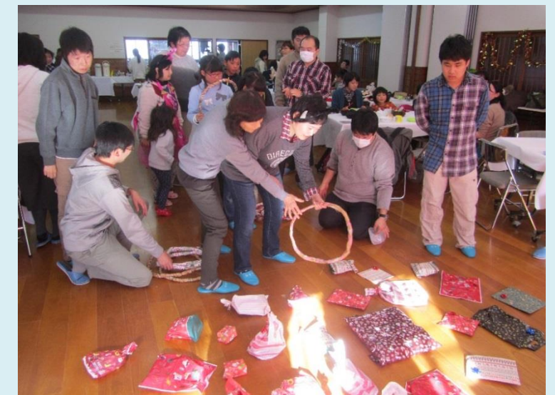
白馬村手をつなぐ育成会 クリスマス会 平成 29 年 12 月 2 日